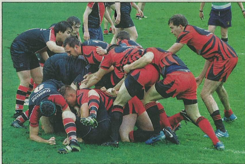
Vollen Einsatz im Kampf um das Rugby-Ei zeigten die Raufbolde (rote Hosen) gegen die Gäste vom TV Memmingen.

Immer wieder wurden Tries sowohl von den Stürmern, als auch der Hintermannschaft er-